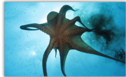
Een octopus spuit inkt

&^%$#@! 876gfds &8%$# 1234%^&()+! 4321@#$%^&() fdss334 67890 poiudy7 trewqa sdfghjkl;/. ,mnbvcxz<>? 87654321. !@#$%^&*()+ 2345tgbnm *&^%$#@ 6789vcxz *&^%$#@! 2345bnmk, 09ijnuh! 321@#$%^&() fdss334 67890 poi.