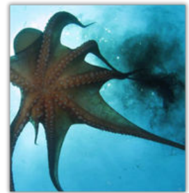
Een octopus spuit inkt

10 Octopussen zijn erg slim. Ze gebruiken hun intelligentie 11 om voedsel te vinden en zich te verstoppen voor 12 vijanden. Hun voedsel bestaat meestal uit krabben, 13 vissen en schelpdieren die ze met hun sterke 14 armen kunnen vangen. Een interessant feitje is dat 15 de octopus heel goed is in het veranderen van kleur.