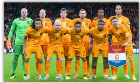
Het Nederlands elftal

&^%$#@! 876gfds &8%$# 1234%^&()+! 4321@#$%^&() fdss334 67890 poiudy7 trewqa sdfghjkl;/. ,mnbvcxz<>? 87654321. !@#$%^&*()+ 2345tgbnm *&^%$#@ 6789vcxz *&^%$#@! 2345bnmk, 09ijnuh! a sdfghjkl;/. ,mnbvcxz<>? 5bnmk 0345.