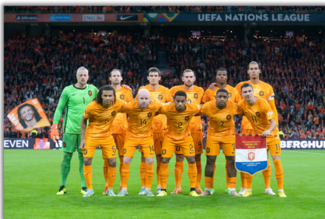
Het Nederlands elftal